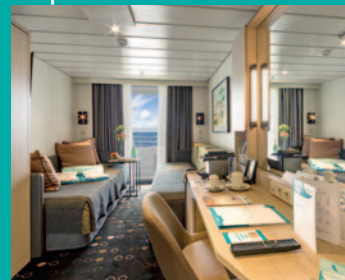
2-Bett, Superior, Balkon, Orion-Deck (Kat. P, PG)