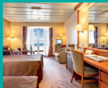
2-Bett, Junior-Suite, Balkon, Jupiter-/Lido-Deck (Kat. S, T)