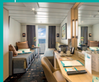
2-Bett, Superior, Balkon, Orion-Deck (Kat. P, PG)