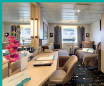
2-Bett, Saturn-/Orion-Deck (Kat. I, K, L, M)